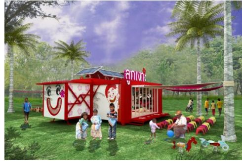
ภาพที่ 4 ทศนียภาพภายนอก