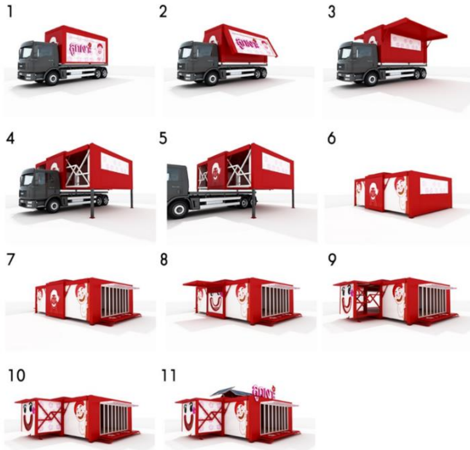
ภาพที่ 1 แสดงภาพการขยายด้วยระบบอัตโนมัติ

เพื่อขยายฟังก์ชันได้โดยอัตโนมัติ โดยออกแบบลวดลายของซาไก เป็นแบบกราฟิกลายเส้นน่ารัก รวมถึงใช้สีแดง สีที่ชนเผ่าซาไกนิยมทำให้งานออกแบบภายนอกดูน่าสนใจ ดึงดูดความสนใจของเด็ก ๆ และง่ายต่อการจัดเก็บ ประหยัดพื้นที่ และเคลื่อนย้ายไปไหนได้สะดวก