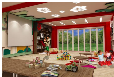
ภาพที่ 5 ทศนียภาพภายใน